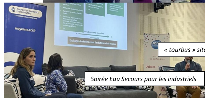
Soirée Eau Secours pour les industriels