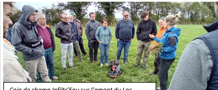
Coin de champ Infiltr’Eau sur l’amont du Lac