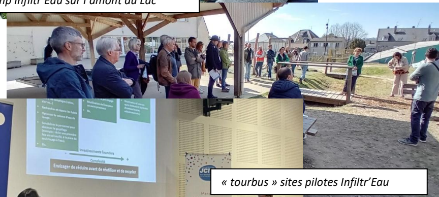
« tourbus » sites pilotes Infiltr’Eau