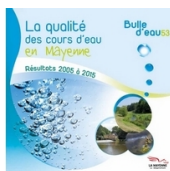
La qualité des cours d'eau en Mayenne 2005-2015