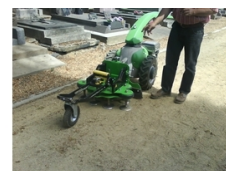
Réunion sur l'entretien des espaces publics, le 5 juillet 2017 à Laval