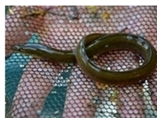
Bilan du plan national de gestion de l'anguille 2010-2015