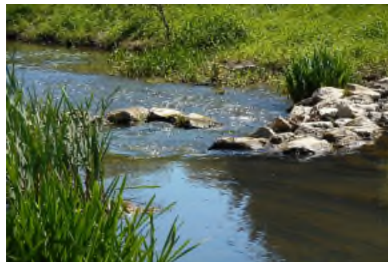
Site de Coupeau (Saint-Berthevin)

Les deux Contrats Territoriaux Eau 2020-2022 préparés entre le SyBAMA, le syndicat de bassin JAVO et l'agence de l'eau Loire-Bretagne, la Région des Pays de la Loire et le Département de la Mayenne, associant le SAGE et l'Etat, incluent la Communauté de Communes du Pays de Château-Gontier et la Fédération de la Mayenne pour la Pêche et la Protection du Milieu Aquatique également porteuses d'actions.