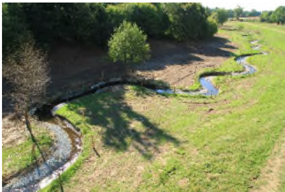
Reméandrage sur le territoire du SyBAMA